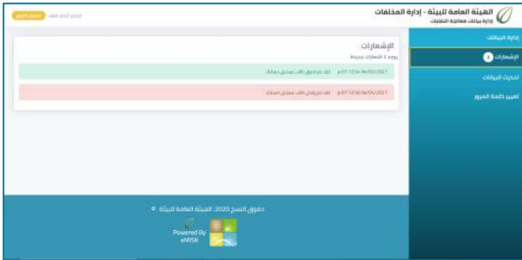
شكل 14: الإشعارات