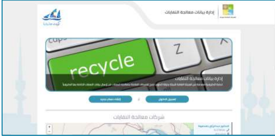
شكل 1: الصفحة الرئيسية لتطبيق إدارة بيانات معالجة النفايات

يقدم هذا الدليل شرحاً تفصيلياً عن كيفية استخدام واجهة الجمهور الخاصة بتطبيق إدارة بيانات معالجة النفايات والذي تم تطويره ضمن مشروع مسح وإعداد قاعدة بيانات شاملة لإدارة النفايات في دولة الكويت eMISKwaste تحت إشراف إدارة المخلفات بالهيئة العامة للبيئة بدولة الكويت.