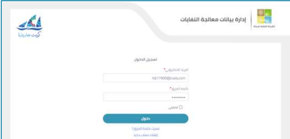
شكل 7: صفحة تسجيل الدخول