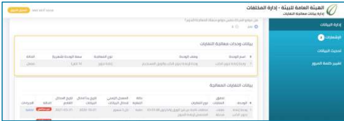
شكل 10: جدول بيانات وحدات معالجة النفايات

تظهر صفحة تفاصيل وحدة المعالجة التي تعرض تفاصيل الوحدة والنفايات.