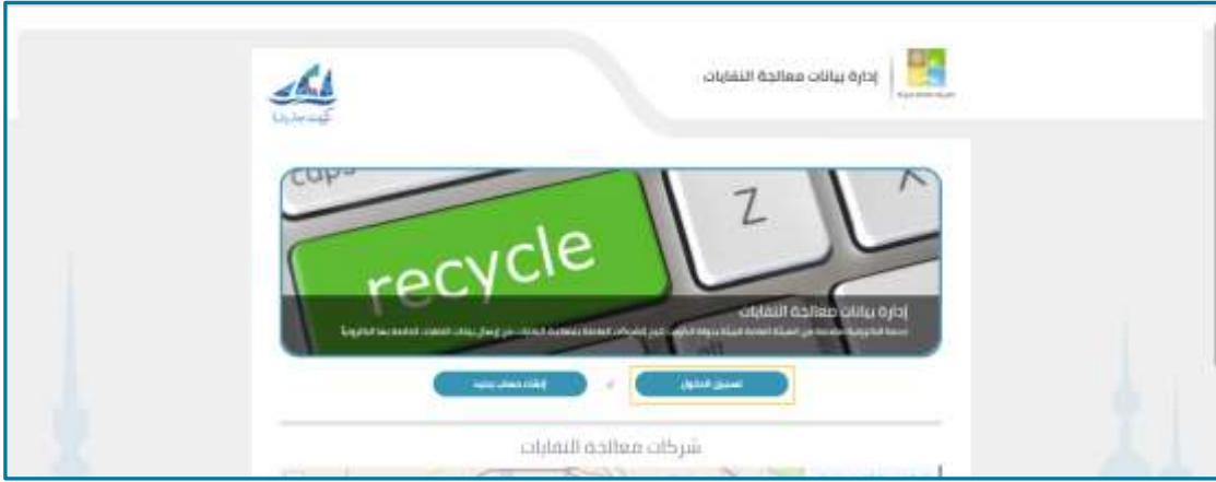
شكل 6: تسجيل الدخول

1. على الصفحة الرئيسية للتطبيق، انقر فوق تسجيل الدخول.