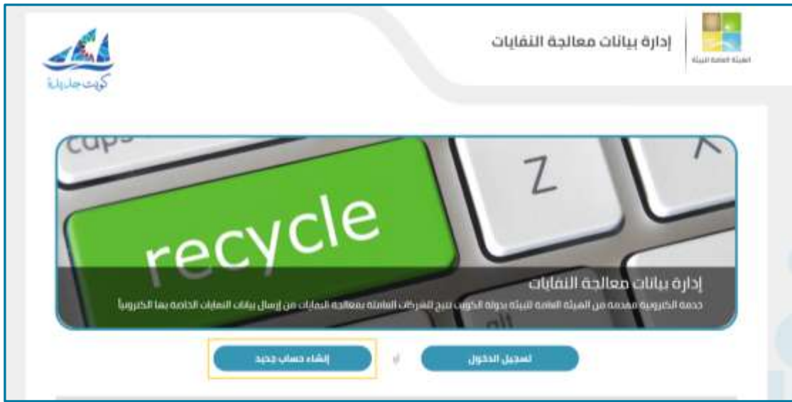
شكل 3: إنشاء حساب جديد

1. على الصفحة الرئيسية للتطبيق، انقر فوق إنشاء حساب جديد.